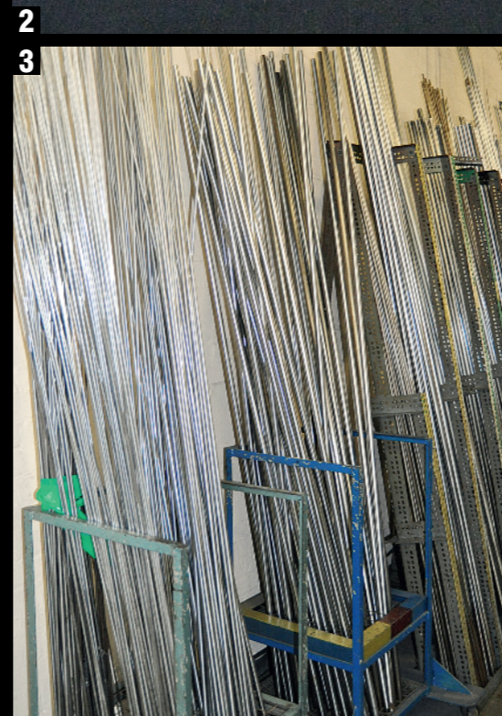
3. Стальные оправы, которые отшлифованы до точных размеров и покрыты тонким слоем хрома, способствуют дополнительной прочности и сохранению предельной точности размеров. Для каждой модели удильца используется особая стальная оправа.