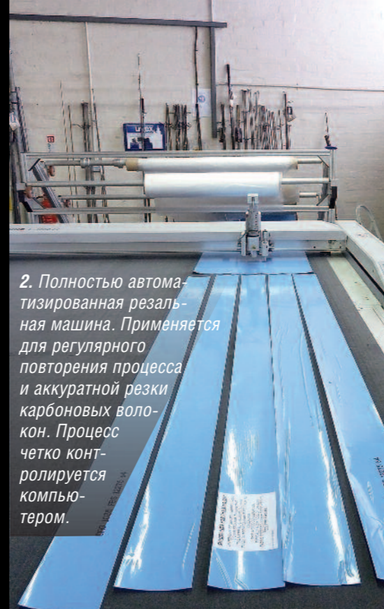
2. Полностью автоматизированная резальная машина. Применяется для регулярного повторения процесса и аккуратной резки карбоновых волокон. Процесс четко контролируется компьютером.

Тестовая кривая – универсальная характеристика изгиба удильца. Однако следует учитывать и строй удильца. Номинальная тестовая кривая, к примеру, 3,25 lb (примерно 1,5 кг) означает, что когда на удильце действует масса, равная 3,25 lb, оно изогнется под углом 90° к горизонтальной плоскости. Но эта характеристика не учитывает другие факторы, которые