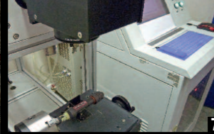
4. Современный сложный раскаточный стол, на котором карбоновые волокна под давлением оборачиваются вокруг специальной стальной оправы. Аппарат отвечает за то, чтобы во время этого процесса волокна не растянулись и не были повреждены.