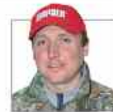
Капитан Олег «Хорошо, надежная леска. Меня очень устраивает!»

Sufix - плетеная леска высокой эффективности, чтобы не ждать второго шанса