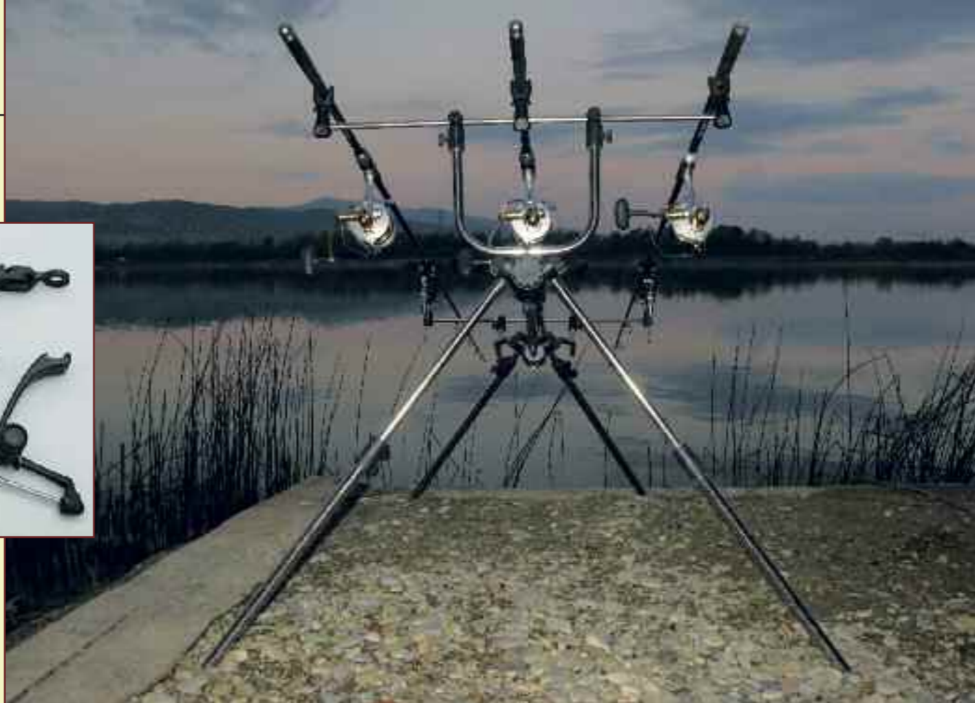
КАРПОВАЯ ЛОВЛЯ. ПОДСТАВКИ ПОД УДИЛИЩА И СИГНАЛИЗАТОРЫ ПОКЛЕВКИ

в одной плоскости, и леска со стороны катушки была максимально поднята. Это обеспечит лучшую чувствительность снасти при поклевке к берегу.