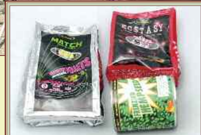
Обед из трех блюд для привередливого карпа, живущего в окружении леща, плотвы и другой белой рыбы. Сезон подачи на стол: осень-весна, когда температура воды ниже 14°.

не ловли, зависит от многих факторов: плотности рыбы в водоеме, ее среднего размера, величины и характера самого водоема, количества удильниц в месте ловли, наличия течения (фото 11). С одной стороны, небольшой размер прикормочного пятна способствует усилению пищевой конкуренции между особями. Карпы спешат перехватить друг у друга лакомый кусочек. С другой стороны, необходимо дать им возможность нормально кормиться, не пугаясь рыбы, попавшейся на крючок. Исходя из этих соображе-